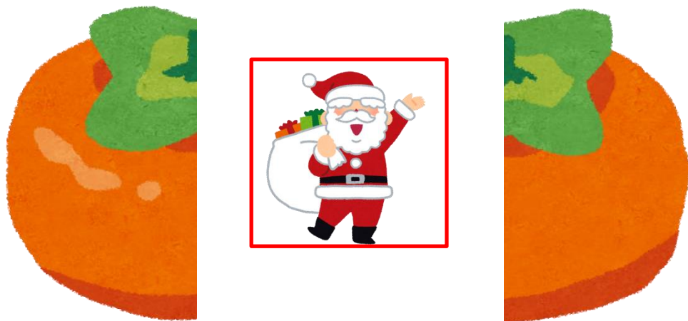
図 が 表 す の は ？