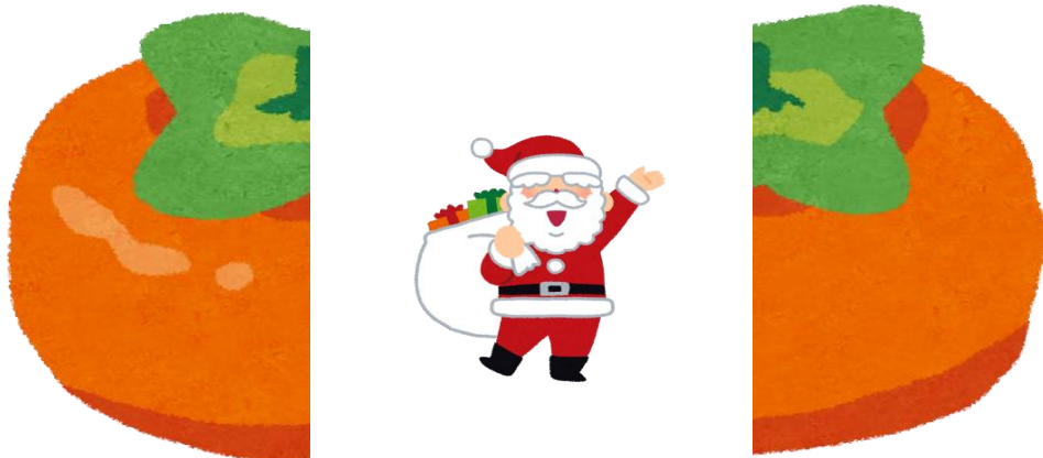
図 が 表 す の は ？

柿の間にサンタがいるため「かさんたき」としても言葉にならない サンタを変換し「3た」→「たたた」として「かたたたき」が正解